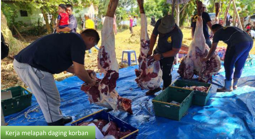
Kerja melapah daging korban