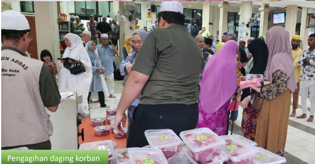
Pengagihan daging korban