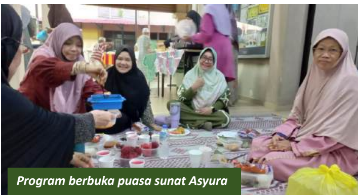
Program berbuka puasa sunat Asyura