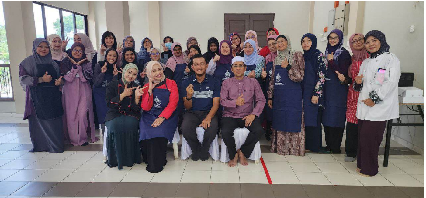
Seramai 22 orang peserta hadir dalam kursus Asas Bakeri Bersama CG Tinaz