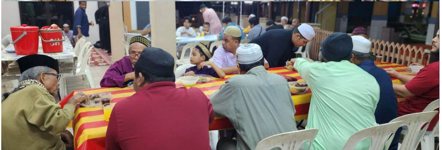
Jamuan AidilAdha hasil korban yang disediakan oleh kaum muslimat hidangan buat jemaah Masjid Ibn Abbas