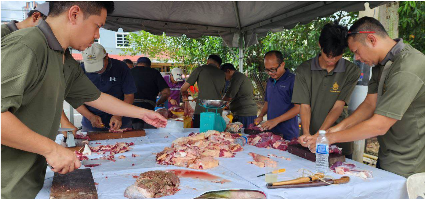
Para sukarelawan penduduk kariah MIATIK saling bekerjasama membuat pembahagian daging korban untuk edaran