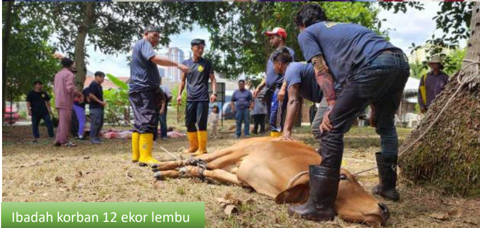
Ibadah korban 12 ekor lembu