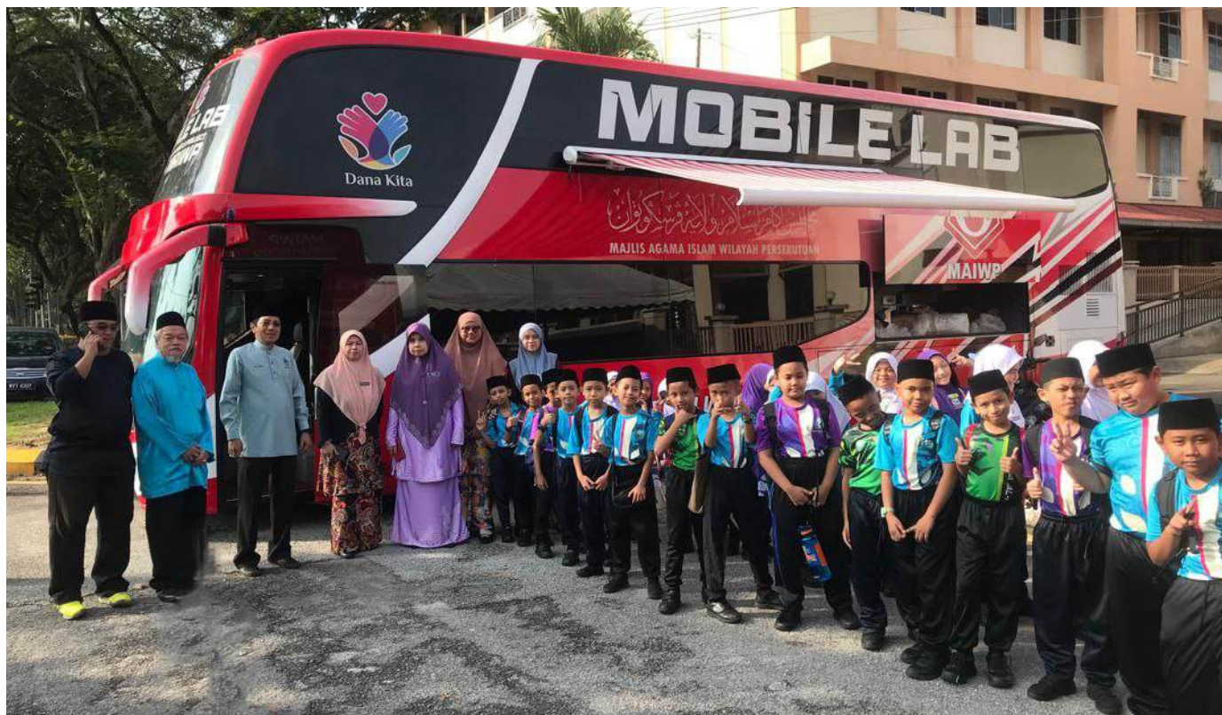
Para pendidik dan pelajar dari Sekolah Agama An-Nawawi Taman Ibukota bersama Jawatankuasa Badan Khairat turut serta dalam pendedahan dunia digital yang disediakan oleh Mobile Lab - Dana Kita dan MAIWP