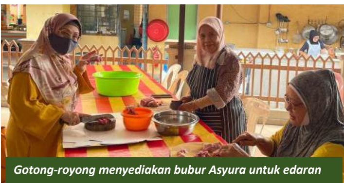
Gotong-royong menyediakan bubur Asyura untuk edaran