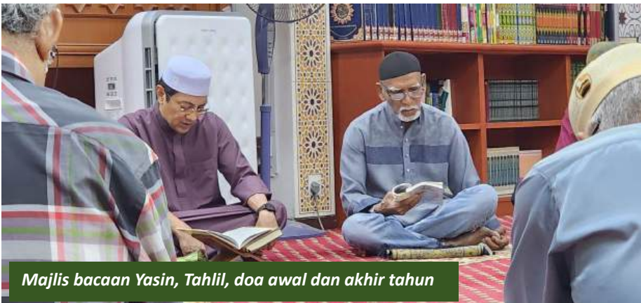
Majlis bacaan Yasin, Tahlil, doa awal dan akhir tahun