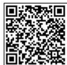
Imbas QR code berkenaan untuk daftar sebagai anak kariah MIATIK.

Antara ujian yang dijalankan termasuk membuat pemeriksaan percuma bagi menyemak kandungan gula dan kolesterol dalam darah, tekanan darah, ukuran indeks jisim tubuh badan (BMI) dan pelbagai lagi. Program dijalankan selama dua hari ini telah memberi manfaat lebih dari 180 peserta yang rata-rata terdiri dari golongan warga emas dalam kariah. - Sumber BKK