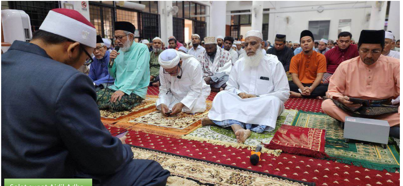
Solat sunat Aidil Adha