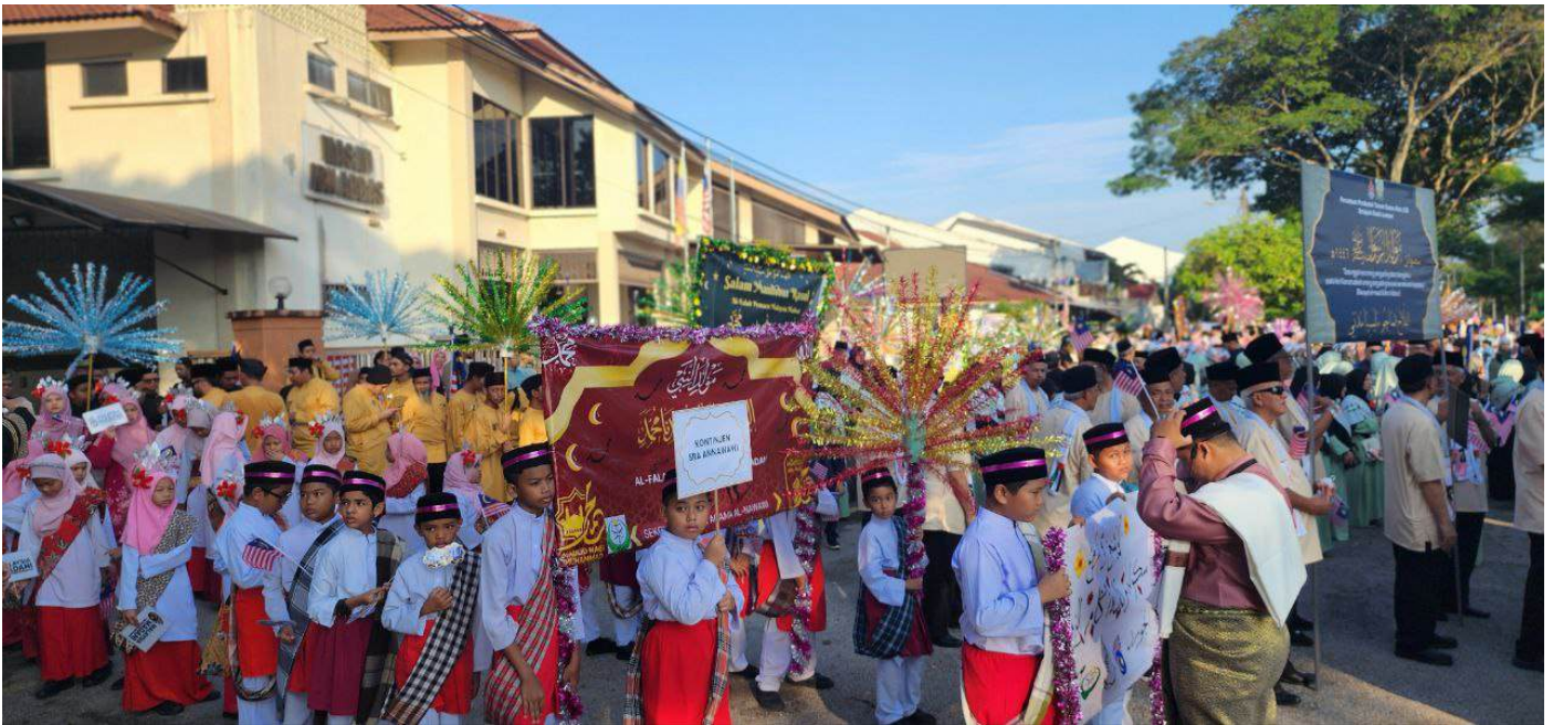
Seramai lebih 700 peserta dari 21 kontigen memeriahkan perarakan Hari Malaysia dan Maulidur Rasul anjuran Masjid Ibn Abbas tahun ini.