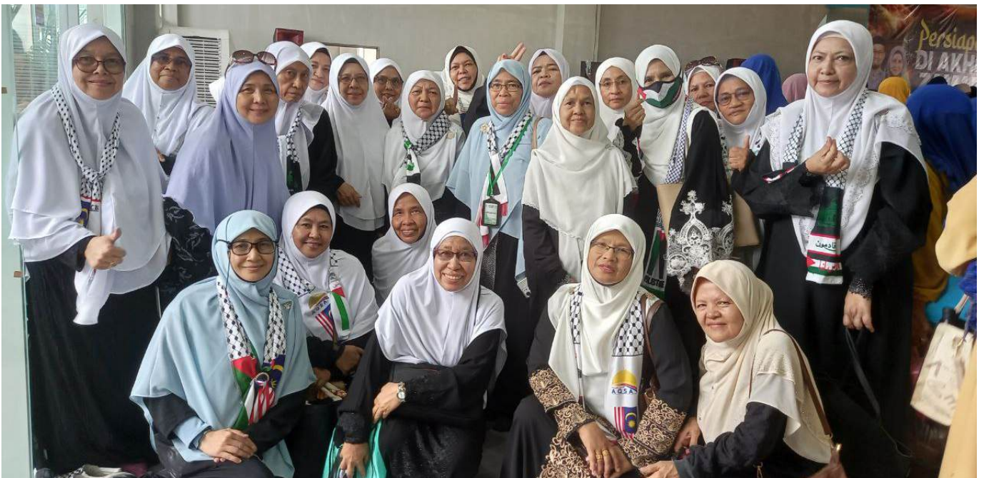
Antara wakil jemaah muslimat Masjid Ibn Abbas yang hadir menyerikan lagi program Kuliah Dhuha Perdana