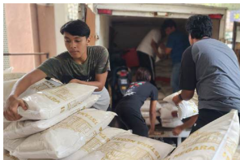
Penerimaan sumbangan beras dilakukan di Masjid Amru Al As, Sentul, KL