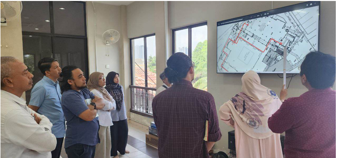
Penerangan dan perancangan kerja naiktaraf dan selenggara masjid dibentangkan oleh konsultan pembinaan