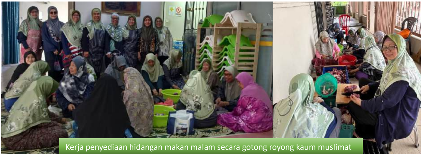
Kerja penyediaan hidangan makan malam secara gotong royong kaum muslimat